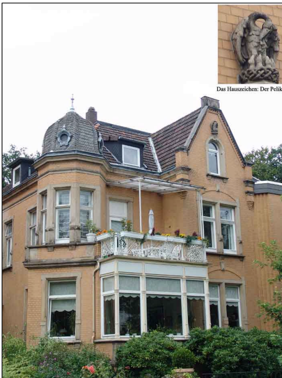
Das Hauszeichen: Der Pelikan

Haus 19 in der Güntherstraße, das Haus Günther Wagners. Im Jahre 2007 kam im Bezirksrat Döhren-Wülfel die Idee auf, das Straßenschild mit einem „Untertitel“ zu versehen, einem Legendenschild.